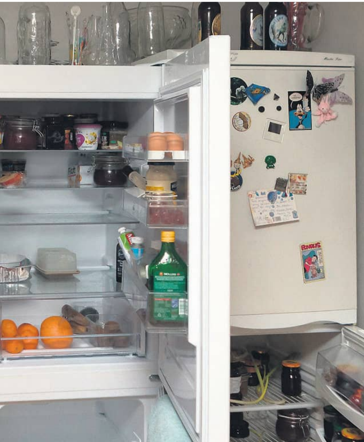
mat i fryser og kjøleskap er ødelagt.