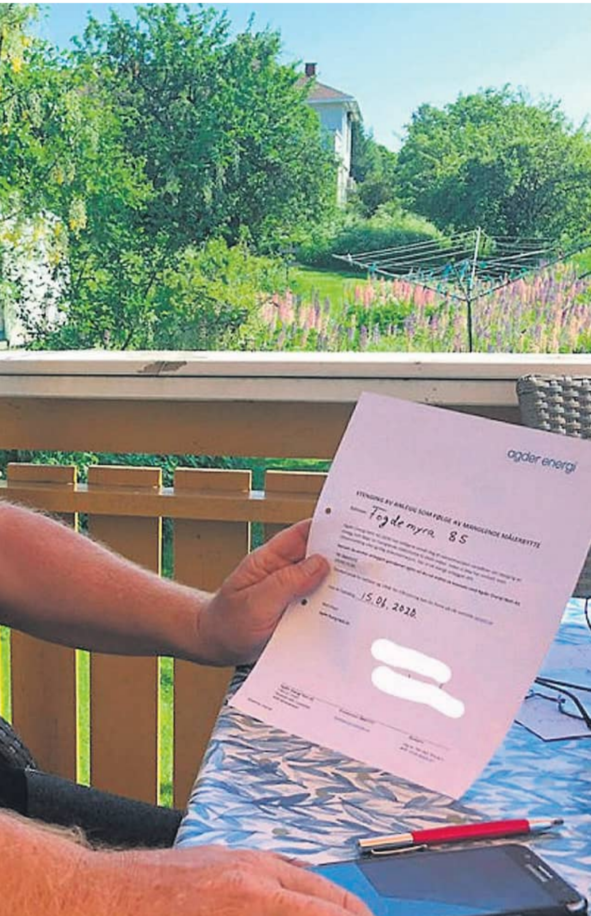
ved. Brevet der det står at anlegget er koblet fra fordi han ikke har svart på det rekommanderte brevet han fikk i januar

dersen, som har sterke motforestillinger mot strålingen fra de nye AMS-målerne, som hun ikke vil ha i hus.