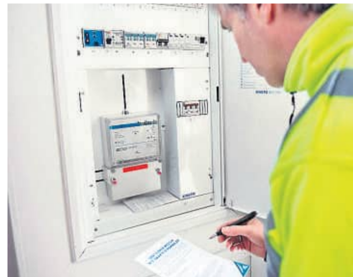
NY STRØMMÅLER: Norges vassdrags- og energidirektorat har bestemt at alle de gamle strømmålerne skal byttes ut med nye, automatiske. De som ikke hadde skiftet mandag, fikk kuttet strømmen.

– Vi informerte kunden om at vi måtte få til et målerbytte (uten radiokommunikasjon) før vi kan gjenåpne anlegget igjen, men kunden nektet, forklarer Cappelen.